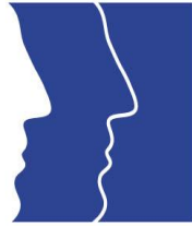
table de concertation des organismes au service des personnes réfugiées et immigrantes